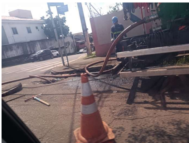
Imagem 2 – Rua Cândido Mendes esquina com a Av Ernestino Borges – Equipe 2