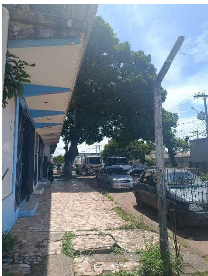
Equipe CSA na Rua Cândido Mendes esquina com a Av Mateus de Azevedo Coutinho Dia 06 de junho de 2026