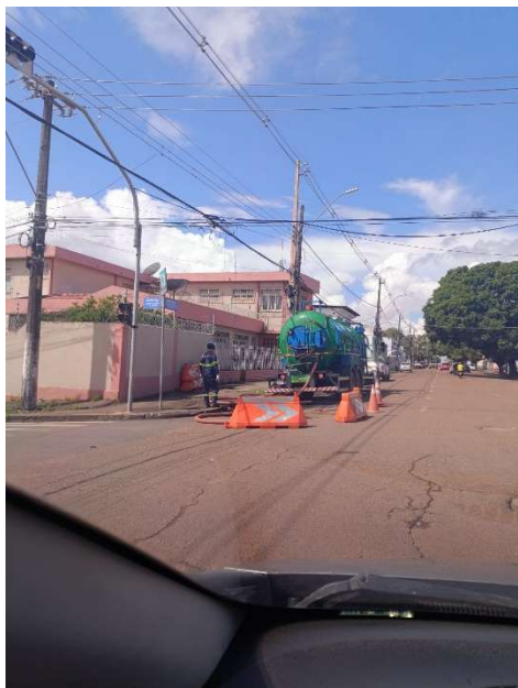
2ª Equipe CSA trabalhando na Rua Cândido Mendes esquina com a Av Ernestino Borges